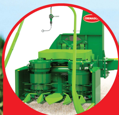
Sistema robusto de raspador em cada colhedor

Possui um sistema de raspador em cada rolo recolhedor, cuja função é efetuar a limpeza na parte traseira, mantendo a eficiência na sua colheita.