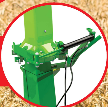
Comando hidráulico de giro de bica