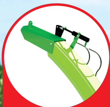
Comando hidráulico ou manual de controle de saída